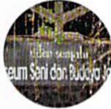
Museum Ullen Sentalu