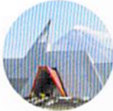
Museum G. Merapi